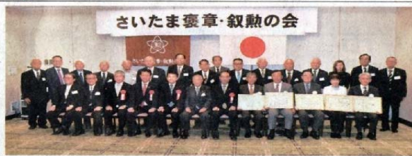
表彰状贈呈式の出席者らーさいたま市大宮区

ポランティア団体を地域貢献活動で表彰 さいたま市在在勤の褒章(叙勲受章者)として、さいたま褒章・叙勲の会(小山景市会長)は16日、本年度のボランティア活動団体表彰状贈呈式を市内で開いた。5団体に表彰状が授与された。表彰されたのは、田島ケ原のサクラソウを守る会(桜区)▽特定非営利活動法人カンソウを育てる会(浦和区)▽フットネットみなみ(南区)▽緑区子ども文化推進連絡会(緑区)▽中央区民生委員児童協議会(中央区)。